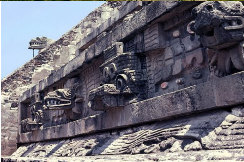
Pirámide de Quetzalcóatl