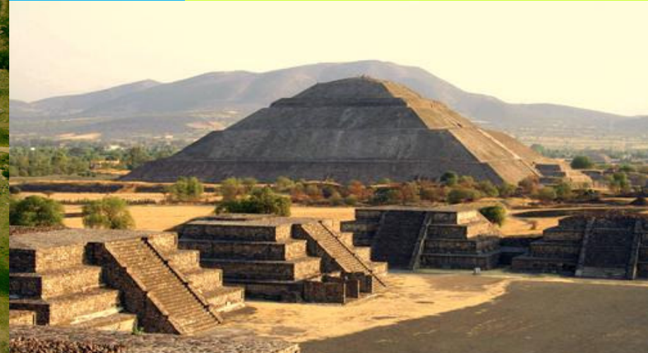
Pirámide del sol