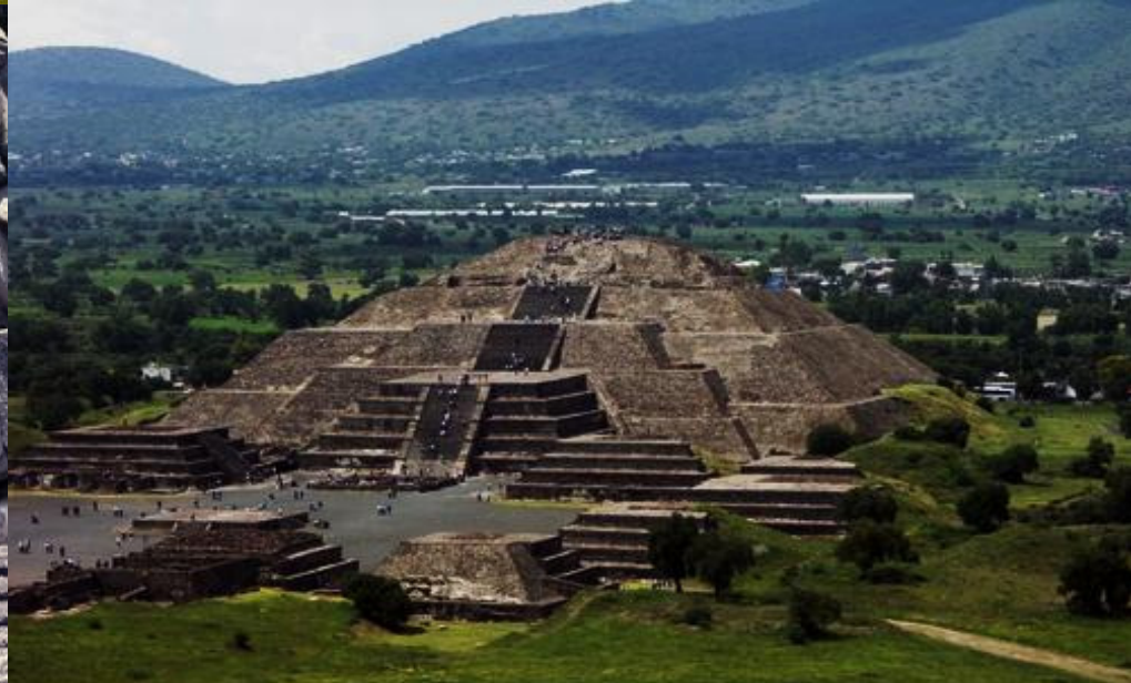
Pirámide de la luna